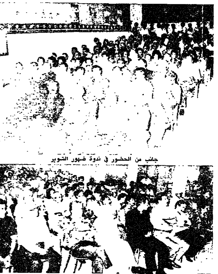
جانب من الحضور في ندوة ظهور الشورى